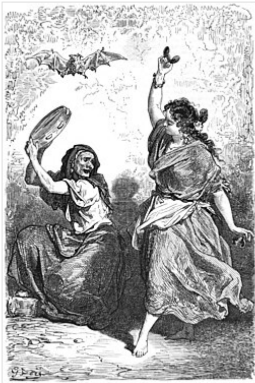
Gitane de Grenade dansant le zorongo (1864)