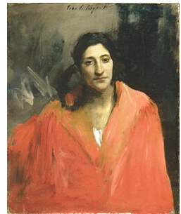
Gitane , 1870-1872, par John Singer Sargent (MET, New York).