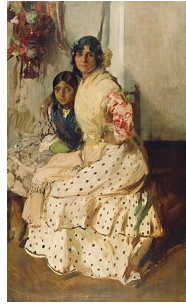
Pepilla la Gitane et sa fille , 1910 Joaquín Sorolla Getty Center, Los Angeles