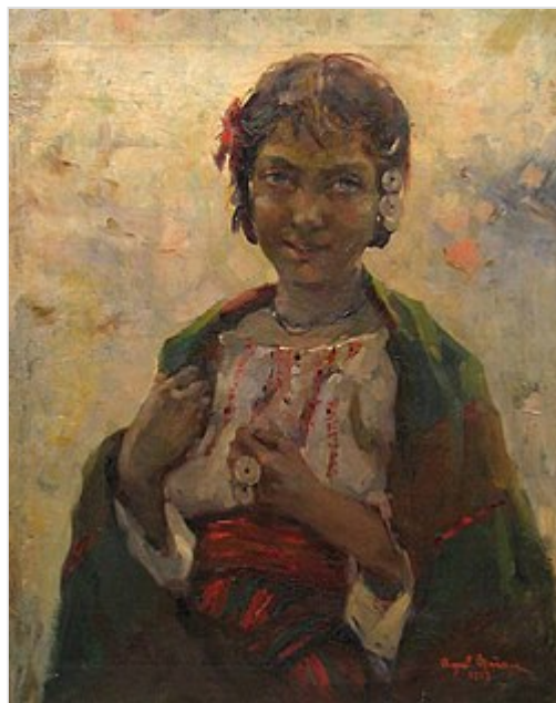
Gitane , Aurel Băeșu ( en ), Roumanie, 1919

Elle est également appelée en castillan romaní español . Langue indo-européenne , fortement influencée par les langues romanes mais aussi le basque , elle comprend de nombreux dialectes : caló español , calão português (portugais), caló catalán , caló vasco ou erromintxela (basque), caló occitan (quasiment éteint, extrême sud de la France), et le calão brasileiro (brésilien).