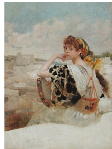
Gitane , vers 1870 Aimé Morot Musée des Beaux-Arts de Nancy