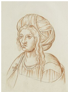
L'Egyptienne qui rendist la santé part art de medecine au roy d'Escoce abandonné des medecins, avant 1573, par Jacques Le Boucq .