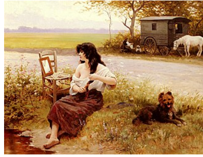
La Gitane à la toilette , 1896 Édouard Debat-Ponsan