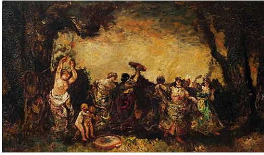
La Danse des gitans Adolphe Monticelli Collection privée