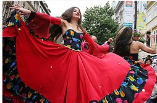
Gitane en tenue traditionnelle à Prague.