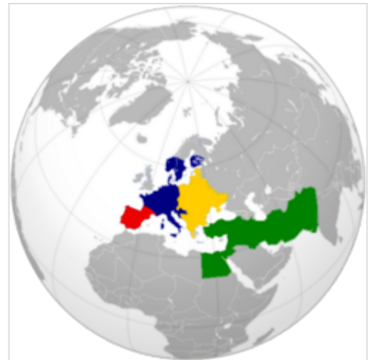
Les différents peuples Tziganes et leurs localisations dans le monde :