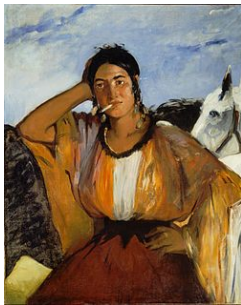
Gitane avec une cigarette , 1862, par Édouard Manet .