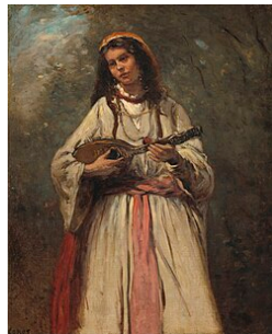
Gitane à la mandoline , vers 1870 Camille Corot National Gallery of Art