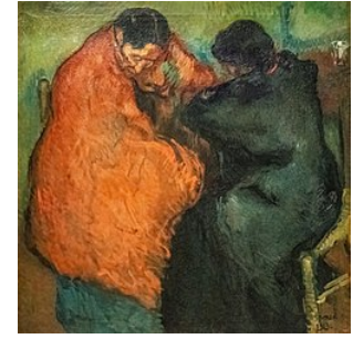
Deux gitanes , 1903 Isidre Nonell